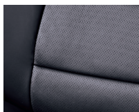
Cuero Gris Oscuro